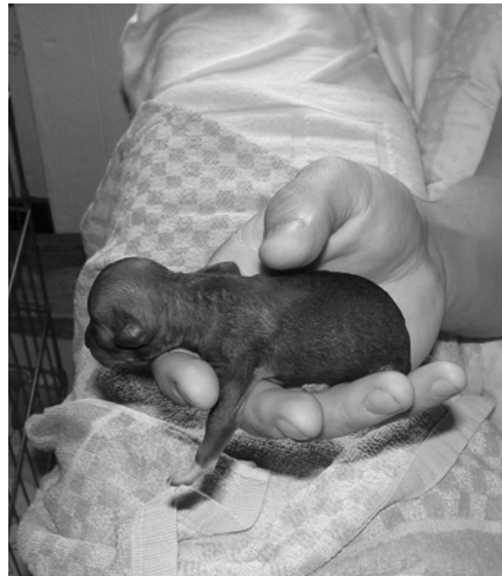
Cindyn ensimmäinen pentu oli kokonaan tumma ja painoi kesäkuussa 2010 syntyessään 160 grammaa.

Nartulle voi aluksi tarjota esimerkiksi lämmintä lihaliენტä, jotta se voimistuu. Myöhemmin, noin kuuden tunnin jälkeen, emolle voi antaa sitä ruokaa, jota on syöttänyt sille viimeiset tiineysviikot.